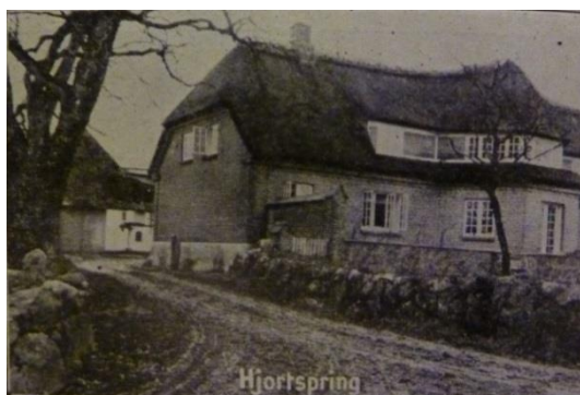
Gården Hjortspring i Svenstrup på Als