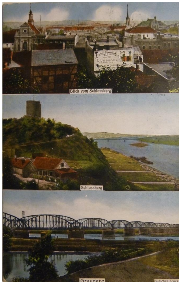
Postkort med partier fra Graudenz