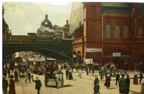
Berlins banegård i Frederichstrasse