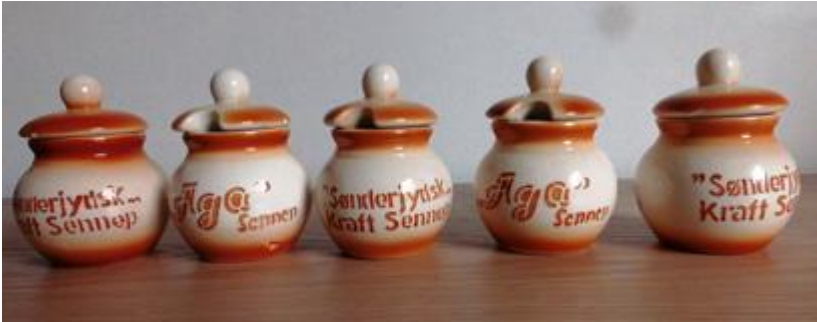
De små karakteristiske porcellænskrukker til Aga-sennep.