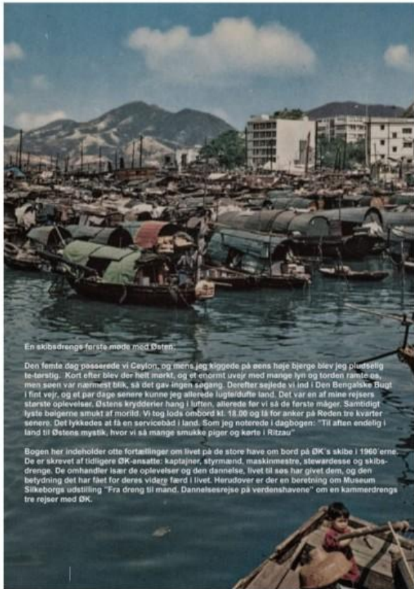
En skibsdrengs første møde med Østen.

Den femte dag passerede vi Ceylon, og mens jeg kiggede på dens høje bjerge blev jeg pludselig te-tørstig. Kort efter blev der helt mørkt, og et enormt lynr med mange lyn og torden raste os, men søen var nærmest blik, så det gav ingen søgang. Derefter sejlede vi ind i Den Bengalske Bugt i fint vejr, og et par dage senere kunne jeg allerede lugtsidufte land. Det var en af mine rejser største oplevelser. Østens krydderier hang i luften, allerede før vi så de første måger. Samtidigt lystt boegerne smukt af morlid. Vi tog lods ombord kl. 18.00 og lå for anker på Reden tre kvarter senere. Det lykkedes at få en servicebåd i land. Som jeg noterede i dagbogen: "Til aften endelig i land til Østens mystik, hvor vi så mange smukke piger og karte i Ritzau"